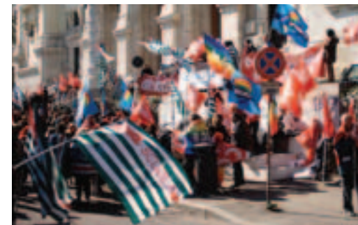
Die „langjährigen Supplenten“ protestieren im Februar 2003 vor der Ministerium in Rom

Vom späten Frühjahr an wurde die geplante Umsetzung der Schulreform begutachtet. Da das entsprechende Dekret im Ministerrat stecken blieb, ohne dass ein Konsens gefunden werden konnte, musste das Ministerium im Juli Notmaßnahmen ergreifen: so wurde erstens wegen der „voreiligen“ Abschaffung der Schulpflicht und Einführung des Rechts auf Bildung bis zur Erlangung eines Fachdiploms mit den Regionen ein 3-jähriger Ausbildungslehrgang für die 14-jährigen Schulabgänger ausgehandelt, welcher die potentiellen Schulaussteiger zurück in die Schule bzw. in die Berufsschule holen sollte (in den Regionen ohne Berufsschulen sicherlich ein schwieriges Unterfangen). Zweitens wurde für die erste und zweite Klasse Grundschule ein Minimalpaket vorgeschlagen, das Englisch und Informationstechnologie einführt (eigentlich bieten das schon viele Schulen an) und es den Schulen erlaubt, den Schulversuch vom letzten Jahr fortzusetzen. Der Nationale Schulrat war aus verschiedenen Gründen nicht besonders begeistert von diesen Vorschlägen und war nur mehrheitlich dafür zu gewinnen.