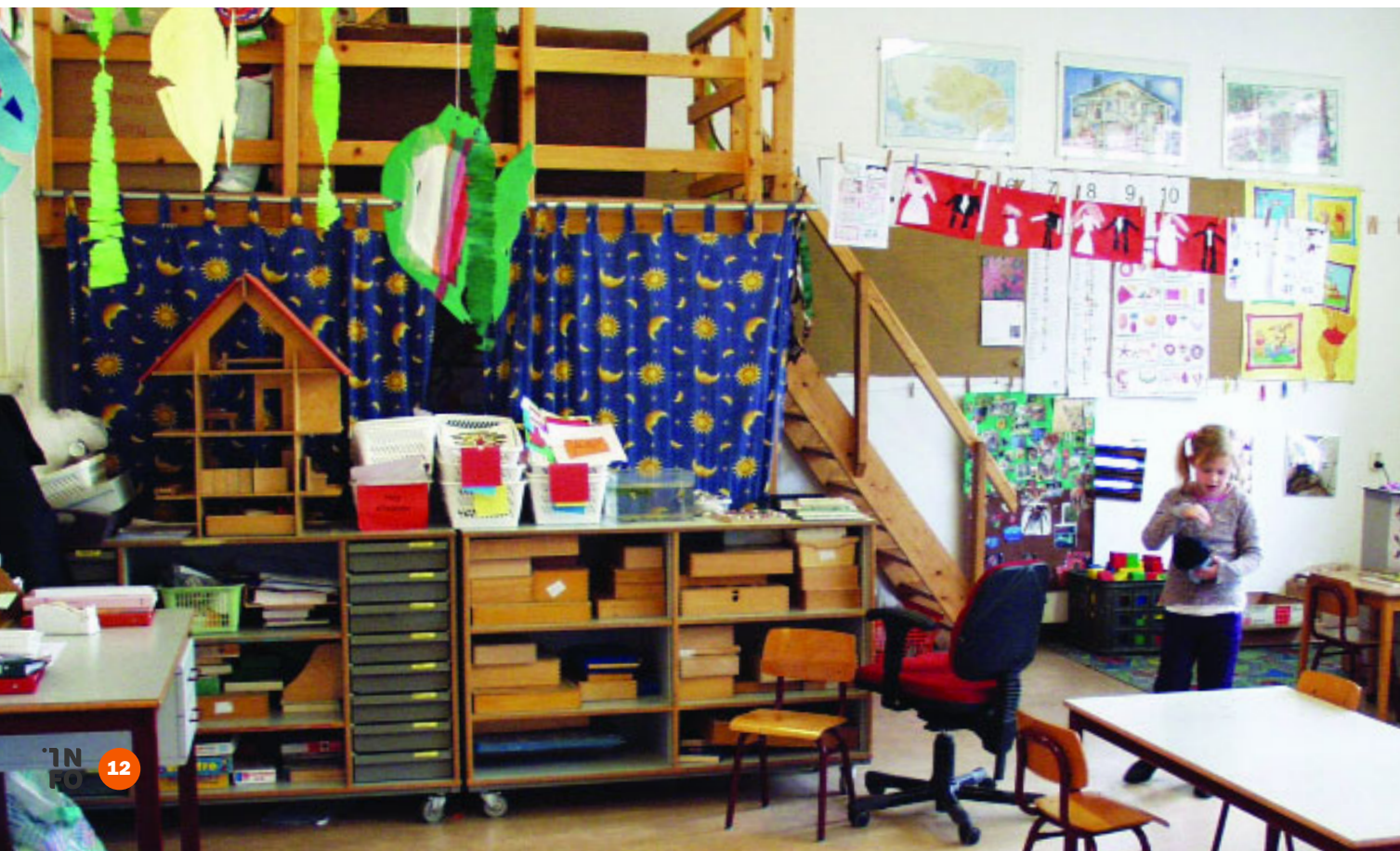
Vorbereitete Umgebung in einer Jenaplan-Klasse

Harald Eichelberger , Pädagogische Akademie Wien