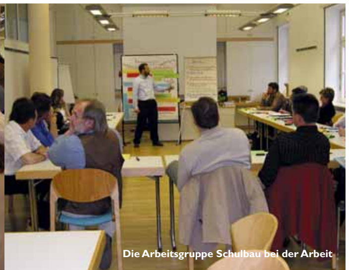
Die Arbeitsgruppe Schulbau bei der Arbeit