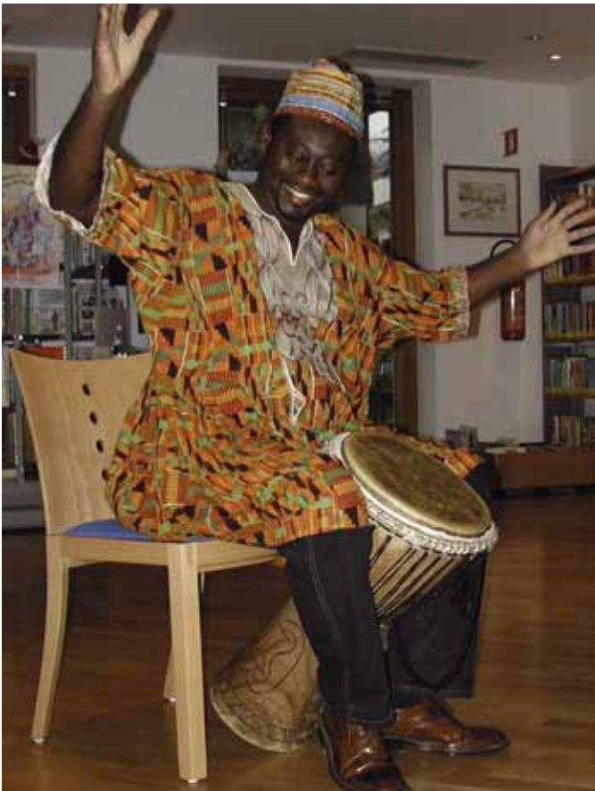
Patrick K. Addai zu Besuch in der öffentlichen Bibliothek Sarntal

Wie ist das, wenn ein afrikanischer Autor, ein Ashanti-Prinz aus Ghana, auf Einladung des Amtes für Bibliothekswesen die öffentlichen Bibliotheken und Schulbibliotheken Südtirols bereist?