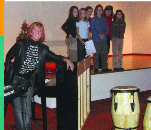
Spannung vor dem Auftritt

Eine besondere Projektwoche im Namen der Musen und der vier Elemente fand Mitte November 2003 im Schulsprengel Bozen Europa statt. In dieser musischen Woche ging es darum, die vier Elemente ganzheitlich zu erleben und sie mit Bewegung, Tanz, Musik, Literatur, Kunst darzustellen. Beteiligt waren 93 Kinder aus den fünften Klassen der Grundschule Pestalozzi und den ersten Klassen der Mittelschule Schweitzer.