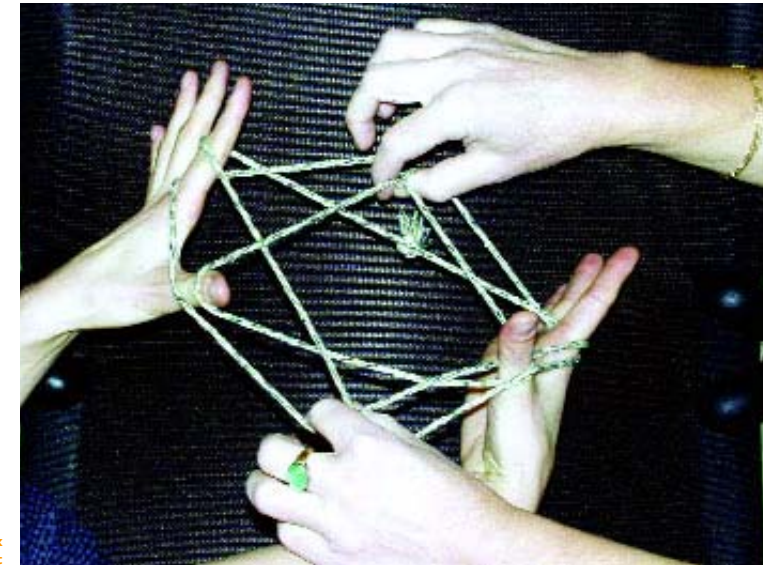
Ein Netzwerk entsteht

Im März und April 2003 wurden 429 Fragebögen an alle Lehrpersonen, Erzieherinnen im Kindergarten und Betreuerinnen im Obervinschgau verteilt. Der Fragebogen sollte Aufschluss