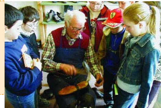
Beim Schuster in der Schule