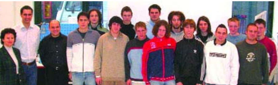
Die Klasse 5Mb der Gewerbeoberschule Bozen auf Besuch im BIC

Zusammenarbeit der Gewerbeoberschule Bozen mit dem BIC Südtirol