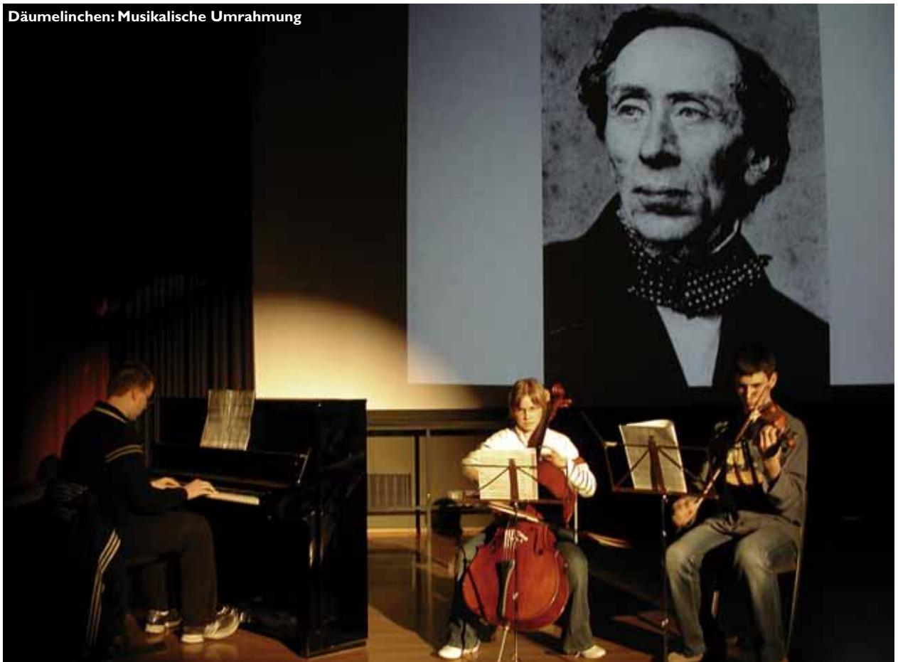
Däumelinchen: Musikalische Umrahmung