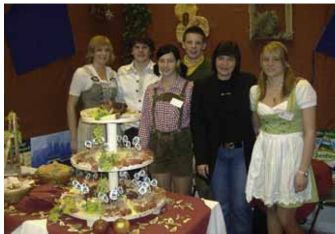
Messestand des Siegerteams GourmetsWorld GmbH der HOB Bruneck

Leiterin der Autonomen Servicestelle der Übungsfirmen Südtirols