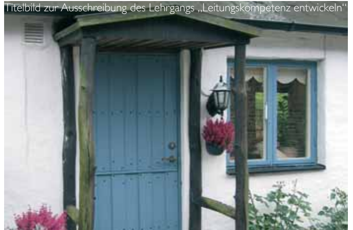
Titelbild zur Ausschreibung des Lehrgangs „Leitungskompetenz entwickeln“

Eine gut überlegte Struktur des Lehrgangs (Module für die Großgruppe, Treffen in Intervisionsgruppen für die Erarbeitung von Teilthemen, Reflexionseinheiten ...) bietet den Rahmen für die Auseinandersetzung mit Inhalten und mit verschiedenen Lern- und Arbeitsformen; dazu gehören auch Reflexionsimpulse zu den eigenen Lernprozessen. Ziele und Vereinbarungen werden im Lehrgangskonzept definiert und schließlich in einem Lernvertrag besiegelt. Evaluierungsgespräche zwischen Kursleiterin, Vertreterin/Vertreter des Pädagogischen Instituts und der Lehrgangsleitung helfen, eine Balance zu bewahren zwischen den Zielsetzungen des Trägers, der Organisation, den Ansprüchen der Teilnehmerinnen und Teilnehmer, den Beiträgen der Referentinnen/Referenten, dem Thema, der Gruppe als Ganzes und den Rahmenbedingungen vor Ort bzw. den Erfordernissen in der Praxis.