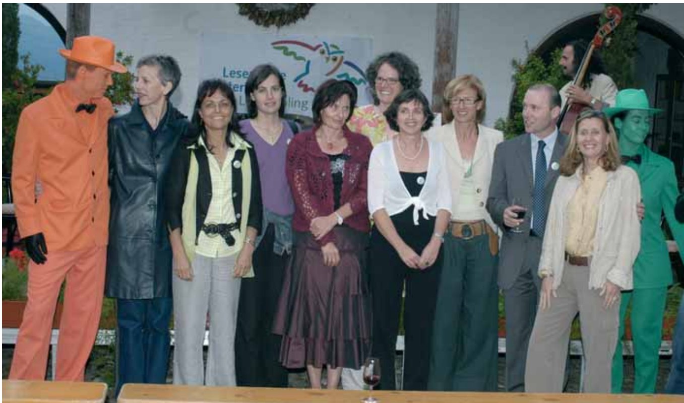
Die Mitarbeiterinnen und Mitarbeiter am LeseFrühling beim Abschlussfest im Happacherhof in Auer

die Welt des Erzählens und Zuhörens. Alle freuten sich über die Geschichten, die in dunklen Stuben, in wunderschönen Sälen, in kuscheligen Ecken oder beim Backofen auf sie warteten.