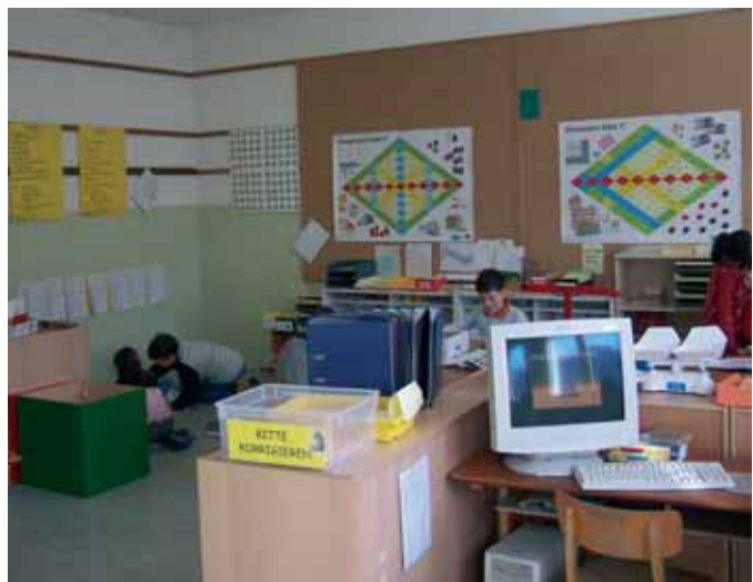
Schule macht Lust auf mehr

Für die höheren Klassen gibt es den Klassenrat, ein demokratisches Gremium, in das alle Kinder ihre Wünsche, Glückwünsche, Kritiken und Informationen einbringen können. Selbstredend wird das einmal wöchentlich tagende Gremium von den Kindern selbst geleitet.