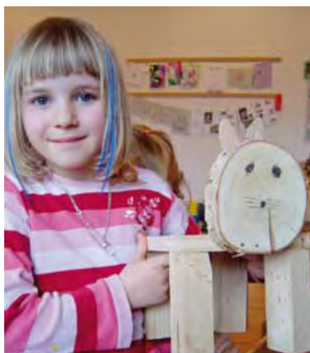
Beim Löwen-Projekt gestalten die Kinder ihren Holzlöwen nach eigenen Vorstellungen.

Neue Erkenntnisse aus der Neurologie und aus anderen Wissenschaften unterstreichen die Nachhaltigkeit des Lernens und der Entwicklung im Kindergartenalter. Dies ließ mich hellhörig werden und ermutigte mich, mich mit dem Team, den Kindern und Eltern und teils auch mit Personen im Dorf immer wieder auf Alltägliches und auf kleine Projekte einzulassen, gemeinsam oder individuell Interessen nachzugehen und Antworten auf Fragen zu finden. Dies bedeutet nicht, den Kindern die gesamte Verantwortung für die Bildungsarbeit zu überlassen, sondern sie daran teilhaben zu lassen. Sie zeigen dann Begeisterung und Ausdauer. So helfen sie beispielsweise bei der Einführung der neuen Kinder, beim Gestalten und Umgestalten von Spielbereichen, beim Einrichten von neuen Aktionsbereichen, bei der Auswahl von Basteleien, beim Jause- und Mittagstisch, beim Kochen und Backen in der Kinderküche, beim Verräumen von Materialien, bei der Gestaltung von Feiern, beim Formulieren von Liedern und Gedichten, phasenweise bei der Auswahl der Gesprächsthemen. Bei Bedarf werden Kindersitzungen einberufen, bei denen Ideen auf Papier gezeichnet werden; anschließend wird die Umsetzung gemeinsam geplant. Bei den älteren Kindern bauen wir verstärkt auf ihr Wissen und ihre Erfahrungen zu aktuellen Themen, sammeln ihre Fragen, planen gemeinsam und definieren ansatzweise individuelle Lernziele und Umsetzungsschritte.