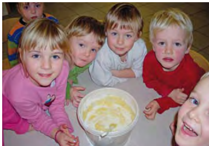
Die Kinderküche ist sehr beliebt, da die Kinder daheim oft wenig Möglichkeiten zum Mithelfen finden.