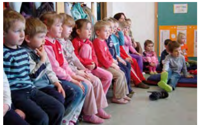
Im Morgenkreis und bei Gruppentreffen ist uns der Dialog mit und unter Kindern wichtig.