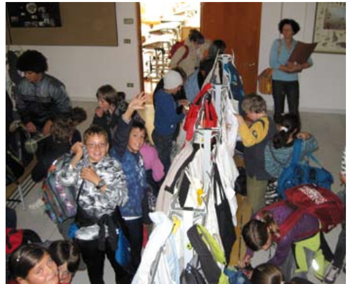
Eine vertrauensvolle Atmosphäre schaffen

Die Ergebnisse der schulstufenübergreifenden Arbeitsgruppen wurden von einem Redaktionsteam gesammelt und allen Lehrpersonen und Schulstellen zur Verfügung gestellt.