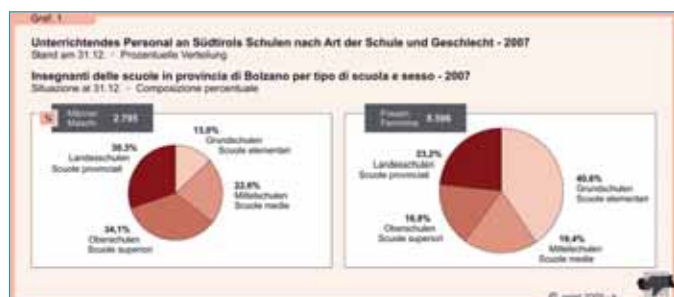
Unterrichtendes Personal an Südtiroler Schulen nach Art der Schule und Geschlecht, Stand: 31.12.2007

Quelle: Landesinstitut für Statistik: „Unterrichtendes Personal an Südtirol Schulen, 2007“ www.provinz.bz.it/astat Februar 2009