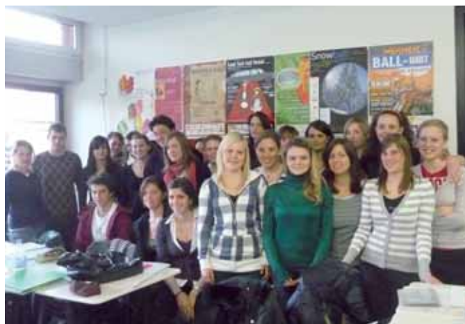
Teilnehmerinnen und Teilnehmer bei einem der Workshops „Unser Maturaball“

Organisator der Workshops zu Maturabällen, ArtPool, Vilpian office@artpool.it