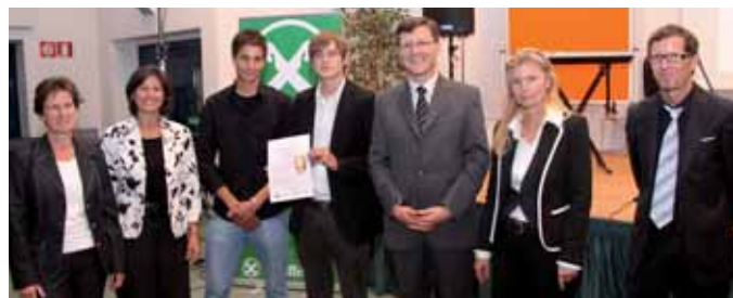
Preisübergabe an stolze Übungsfirma: Security Systems OHG der HOB Bozen

Um das Zertifikat zu erlangen, mussten die teilnehmenden Übungsfirmen verbindliche Standards erfüllen, die von einer Fachjury in Salzburg bewertet wurden. Insgesamt haben sich 300 Übungsfirmen aus dem kaufmännischen Schulwesen, davon 25 aus Südtirol, der Herausforderung gestellt. Alle Südtiroler Übungsfirmen erhielten das begehrte Qualitätszertifikat. Es berechtigt die Übungsfirmen, das Qualitätssiegel für zwei Jahre zu verwenden. Zurzeit sind 95 Prozent der Südtiroler Übungsfirmen zertifiziert.