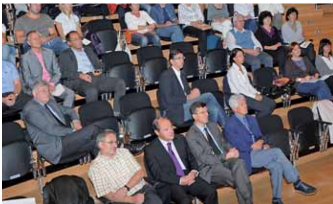
Schulverwaltungs-kräfte: Dreh- und Angelpunkte im Verwaltungsablauf