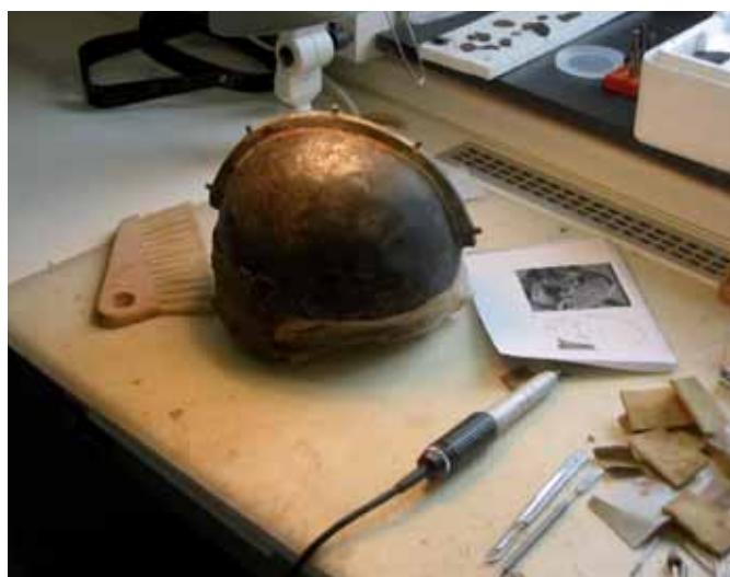
Antike begreifen: kreativ sein im Lateinunterricht

In dem Programm geht es um eine generelle Sensibilisierung für den gesellschaftlichen Wert humanistischer Bildung. Es richtet sich gleichermaßen an Schülerinnen und Schüler sowie Lehrpersonen, an Eltern und außerschulische Partner. Im „Förderprogramm im sprachlich-expressiven Bereich“, das im Schulamt koordiniert wird, sollen die klassischen Sprachen auch weiterhin angemessen vertreten sein. Hierzu sind adäquate Unterstützungsangebote für Gymnasien mit Latein und Griechisch sowie ein adäquates Fortbildungsangebot für Lehrpersonen nötig.