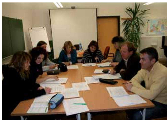
Eltern, Lehrpersonen und Schulführungskraft arbeiten gemeinsam.

Wir haben bislang noch keine Schule erlebt, die die Einbindung der Eltern nicht als Gewinn gesehen hätte. Eine Lehrerin nach einem zweijährigen Prozess der Schulprogrammarbeit mit Einbindung von Elternvertretern: „Das war eine fruchtbringende Zusammenarbeit. Unser Schulprogramm steht jetzt auf festen Füßen, weil es auch von den Eltern mitgetragen wird. Die Elternvertreter haben sehr engagiert mitgearbeitet. Das war eine große Unterstützung für uns als Steuergruppe.“ Aus den Rückmeldungen wird deutlich, dass Eltern eine erweiterte Außen-sicht einbringen, und dass sie – aus verschiedenen beruflichen Kontexten kommend – eine wertvolle Wissens- und Kompetenzerweiterung beisteuern. Sie bringen eine zusätzliche Perspektive im Hinblick auf den Entwicklungsprozess ein. In allen Sparten gibt es das Phänomen der Berufsblindheit. Hier können Eltern ein wirksames Gegenmittel darstellen.