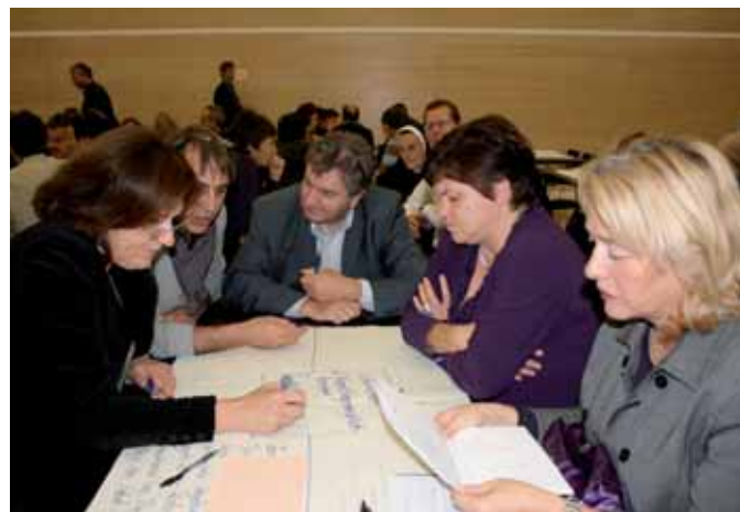
Herbsttagung: Unterrichtsentwicklung – Beurteilung und Förderung guten Unterrichts