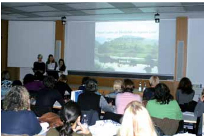
Projektvorstellung: Eine Lehrfahrt nach Rumänien

jekt wurde sehr anschaulich von vier Schülerinnen vorgestellt. Die ladinischen Grundschulen Enneberg und Wolkenstein erläuterten ihr Projekt „Info“, während der italienischsprachige Schulsprengel Gries sein Schulentwicklungsprojekt vorstellte. Einige wortgewandte Schülerinnen des Realgymnasiums Schlanders gaben Einblick in ihr Minderheitenprojekt mit Siebenbürgen, wertvolle Tipps zur Studienreise Brüssel und eine Kostprobe des selbst erarbeiteten Europaquiz. Die Kunstschule „Cademia“ in St. Ulrich zeigte eine Reihe beeindruckender Werke, die im Rahmen des Comenius-Projektes „Women in Art“ erarbeitet wurden. Die italienischsprachigen Oberschulen ITC „Cesare Battisti“ Bozen und Liceo Classico „Cantore“ Bruneck sprachen über die Ziele, Organisation, Finanzierung und die Ergebnisse ihrer Betriebspraktika in Wales und Bayern. Dazu kamen viele Fragen und Wortmeldungen aus dem Publikum. Zu guter Letzt sprachen Schülerinnen des Humanistischen Gymnasiums Meran über ihre Erfahrungen mit der Initiative „Schulbrücke Europa“, während eine Schülerin des Humanistischen Gymnasiums Bozen über ihre Teilnahme an der Sommerschule Weimar berichtete.