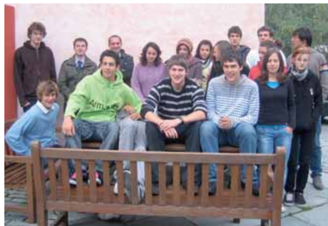
Quid facis in tempore hiemali?