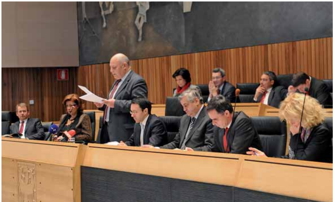
Landeshauptmann Luis Durnwalder bei seiner Rede zum Haushalts- voranschlag des Landes für 2010 im Südtiroler Landtag

vom „Weiter so“ verabschieden, schlicht und einfach, weil dieses „Weiter so“ nicht mehr finanzierbar wäre. Was wir also getan haben, war, den Haushalt neu zu ordnen, zu strukturieren, herauszuarbeiten, welche Bereiche wir als strategische empfinden. Diese strategischen Bereiche haben trotz der allgemeinen Haushaltskürzung keine wesentlichen Kürzungen erfahren, sind im Vergleich zum Vorjahr gleich gehalten, in manch einem Fall sogar um einiges angehoben worden.