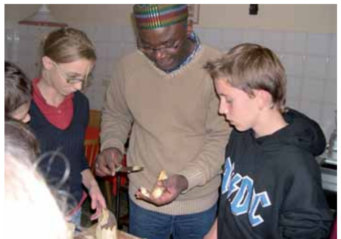
Das Wort in der Begegnung – faszinierend