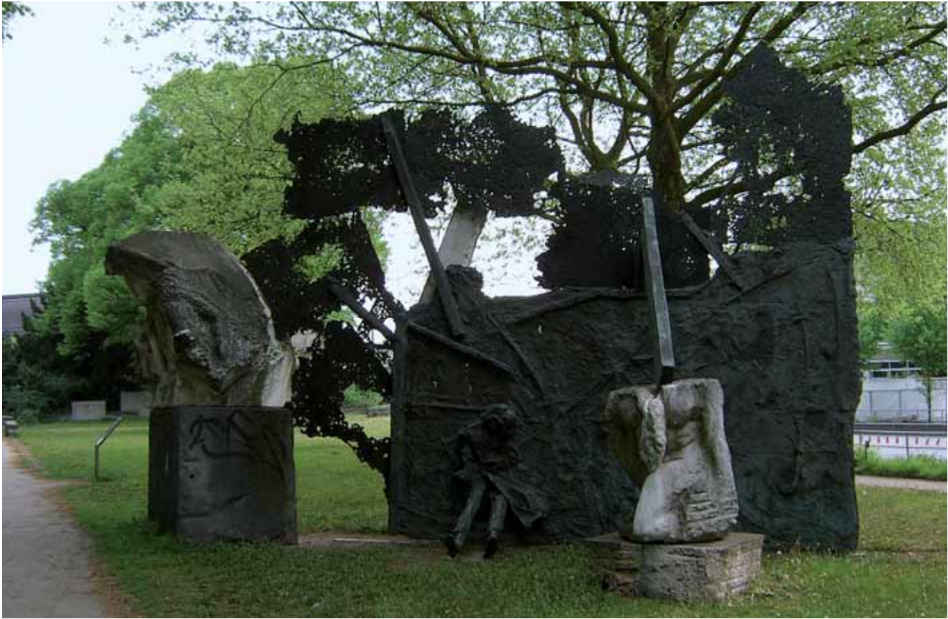
Alfred Hrdlicka (1928–2009), Gegendenkmal in Hamburg