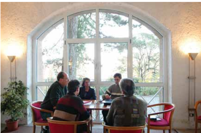
Innehalten und nachdenken lohnt sich.

Die Teilnahme hilft, das Tempo des Alltages zu reduzieren, Raum zu schaffen und dadurch Zeit für eine Reflexion über sich selbst und die eigene Tätigkeit und für ein überlegteres Handeln zu haben. Gerade dieses Innehalten und dieses In-sich-Kehren stellt eine lohnenswerte Investition dar, und zwar nicht nur für sich selbst, sondern auch für die Menschen, die uns umgeben, sowie für die Organisation, in der wir tätig sind. So profitieren letztlich neben den Teilnehmenden vor allem die Schülerinnen und Schüler von diesem Reflexionsangebot. Allerdings sind die Freiwilligkeit und die Bereitschaft, sich auf Veränderungsprozesse einzulassen, unerlässlich, damit Supervision erfolgreich verlaufen kann.