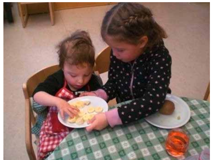
Die Hilfsbereitschaft der Kinder ist beeindruckend.

Jedes Kind wird mit seinen Stärken und Schwächen mit der Zeit Teil der Gruppe. So wächst das Zusammengehörigkeits-