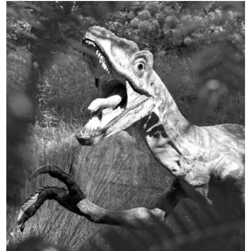
Die Gärten von Schloss Trauttmansdorff