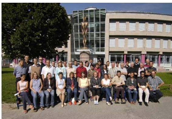
Das Lehrerkollegium bei der Pädagogischen Tagung

Respekt Verantwortungsgefühl Ehrlichkeit Einfühlsamkeit Fairness Eigeninitiative Beharrungsvermögen Integrität Mut Optimismus