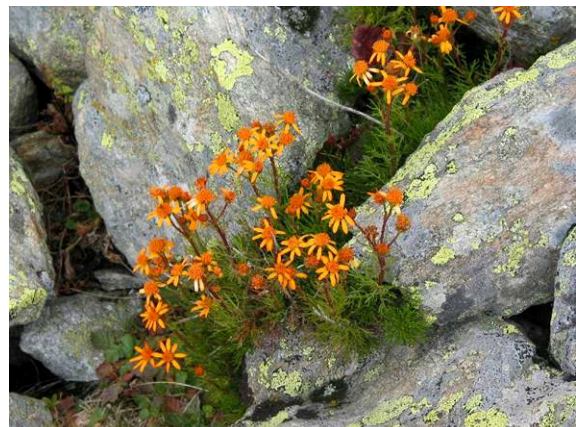
Blumen blühen zwischen den Steinen