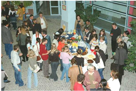
Eltern-, Lehrer- u. Schülertreffen der ersten Klassen