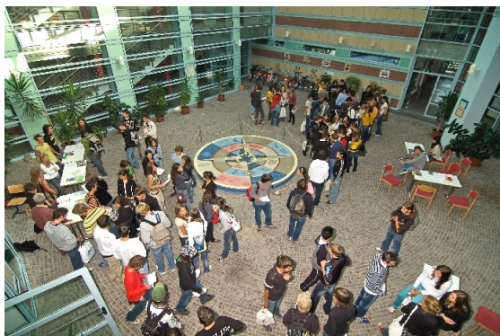
Büchermarkt im Schulhof