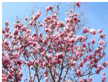
Wetterkapriolen im Frühling

Die Statistikblätter sind sauber ausgefüllt jeweils am Monatsende im Sekretariat abzugeben, das letzte am 15. Juni.