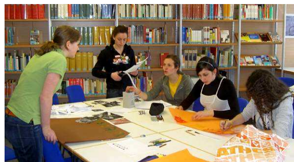
die „indischen“ Künstlerinnen