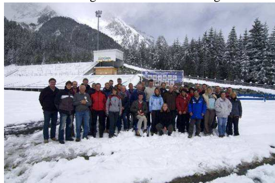
Lehrpersonen und Verwaltungspersonal nach dem Biathlonwettbewerb am 5. September in der Südtirol Arena

Erlebnispädagogik war das diesjährige Thema bei der Herbsttagung des Lehrerkollegiums. Dabei ging es nicht um theoretische Überlegungen und lange Diskussionen, sondern es wurde in konkretem Tun Team- und Gruppenfähigkeit gelebt bzw. erlebt sowie Verantwortung für einander bewusst gemacht.